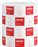
460201 Katrin System Handtuchrolle M 1-lagig

Beispielhafte Auswahl aus allen Ländern. Die Verfügbarkeit für einzelne Regionen finden Sie auf der Webseite.