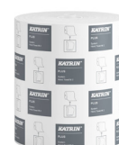
58167 Katrin Plus System Handtuchrolle M 2-lagig