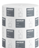
57795 Katrin Plus System Handtuchrolle M 2-lagig