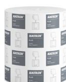
460058 Katrin Plus System Handtuchrolle M 445 Blatt 2-lagig