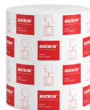
460102 Katrin System Handtuchrolle M 2-lagig