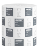
38015 Katrin Plus System Handtuchrolle M 3-lagig