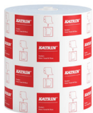
460218 Katrin System Handtuchrolle M 1-lagig, Blau