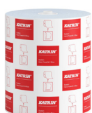
460263 Katrin System Handtuchrolle M 2-lagig, Blau