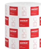
58198 Katrin System Handtuchrolle M 2-lagig