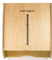
90865 Green Hygiene Falthandtuchspender Birke Sperrholz, natur