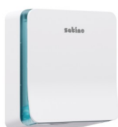
90928 Satino Falthandtuchspender S Kunststoff, weiß