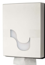
90889 Celtex Falthandtuchspender Kunststoff, weiß